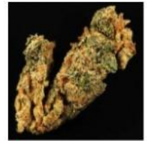
▲ Alerte: cannabi... 5F-MDMB-PICA 06.10.2020