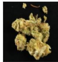
▲ Alerte: Cannabi... 5CI-ADB-A 10.07.2020

Le cannabis actuellement vendu sur le marché illégal en Suisse contient régulièrement des cannabinoïdes synthétiques qui peuvent mener à une surdose mortelle. Il est impossible de le différencier à l'œil, à l'odeur ou au goût d'un cannabis à haut taux de THC.