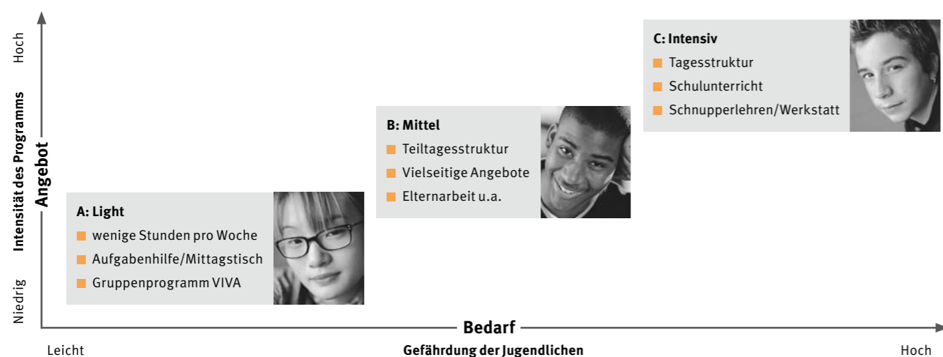
Abb. 2: Bedarf und Angebot in der Prävention für gefährdete Jugendliche

Die Forschung zeigt, dass die auffälligen Jugendlichen keine homogene Gruppe bilden. Deshalb ist es wichtig, den Gefährdungsgrad zu erfassen und den Jugendlichen die Hilfe anzubieten, die ihrer Situation angemessen ist. Die supra-f Jugendprogramme können je nach Intensität des Angebots in drei Typen aufgeteilt werden (Abb. 2). Für nur leicht gefährdete Jugendliche, die oft in einem relativ intakten Umfeld leben, genügen punktuelle Fördermassnahmen vom Typ A. Jugendliche mit schwerwiegenden Verhaltensmustern und fehlendem oder ressourcenschwachen sozialen Netz benötigen intensivere Angebote in Teiltages- oder Tagesstrukturen (Typ B und C). Die Kombination von mehr als einem Angebotstyp in derselben Einrichtung ist möglich, verlangt aber entsprechend mehr Personal und eine ausgebauten Infrastruktur.